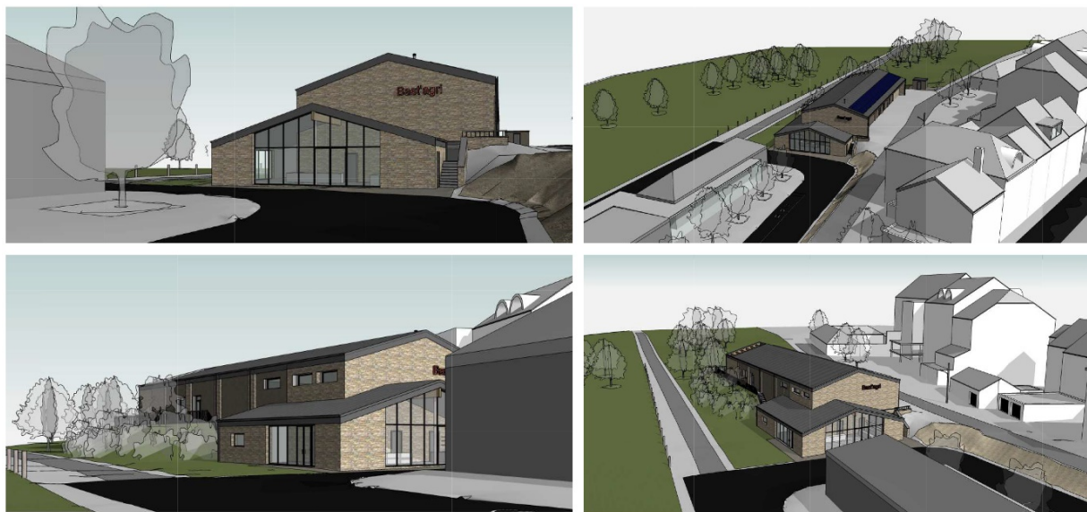
Projet du hall relais agricole

Le hall relais agricole sera lui aussi implanté sur le site de la Gare du Sud. Il sera construit au nord-est du bâtiment de la gare, à proximité immédiate de celui-ci, et s'appuiera sur le talus le long du Ravel. Un soin tout particulier a été apporté à l'architecture et aux matériaux de parement afin d'intégrer le nouveau bâtiment dans le paysage et préserver la qualité de l'espace bâti environnant, en particulier le bâtiment de la gare. Le permis d'urbanisme a été délivré le 6 mars 2020. Le hall relais agricole (devant ouvrir fin 2022) représente un investissement total de 2.500.000 euros financé par la Région Wallonne et les 6 communes associées. Une demande de subside est également introduite auprès de la Province de Luxembourg.