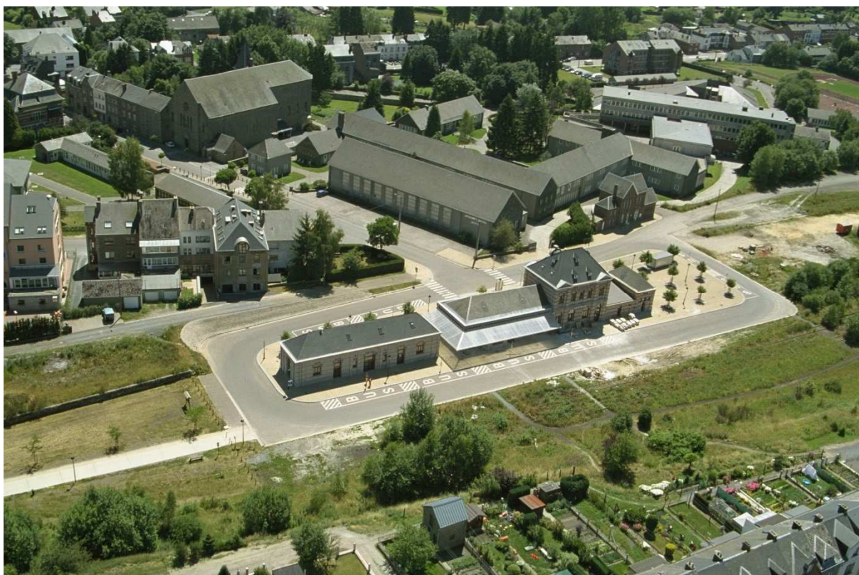
Site de la Gare du Sud à l'heure actuelle

Benoit LUTGEN, Bourgmestre de Bastogne, a présenté ce vendredi 18 septembre le projet global de valorisation du site de la Gare du Sud. Au centre des préoccupations de la Ville depuis plusieurs années, cette zone, située en plein cœur de Bastogne, est stratégique pour le développement de la mobilité douce et pour soutenir l'économie locale, ainsi que le tourisme. Ce site disposant d'un potentiel remarquable, va faire l'objet d'une réhabilitation complète et connaître une nouvelle vie grâce à l'implantation de nouvelles fonctions à destination de la population et des touristes. Ainsi, plus de 5 millions d'euros vont être investis par la Commune de Bastogne, la Région Wallonne et leurs partenaires afin de donner à ce site l'attractivité qu'il mérite.