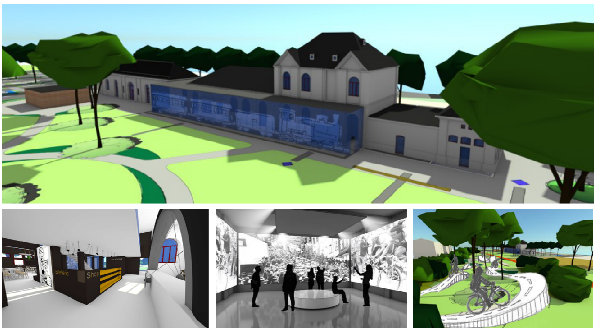
Projet du centre de référence du vélo

Depuis lors, les équipes de projets œuvrent sur le dossier afin de déposer une demande de permis pour début 2021.