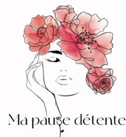
Ma pause détente